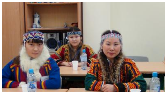
( http://nvinder.ru/sites/default/files/gazeta/2013/12/dsc01572_01.jpg )

Выпуск № 141 (20053) от 17 декабря 2013 г. (/newspaper/1922) Общество (/rubric/obshchestvo)