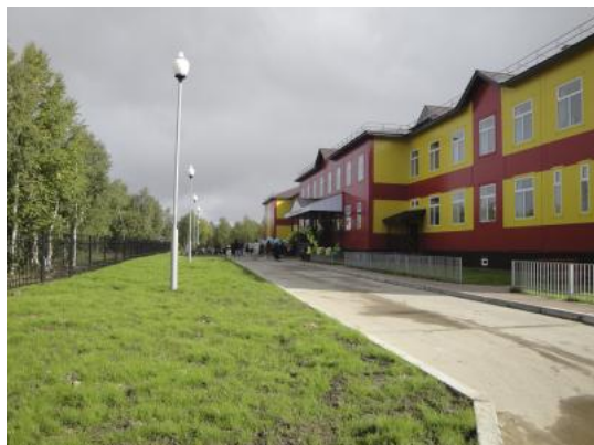
( http://nvinder.ru/sites/default/files/gazeta/2017/07/6.jpg )

Выпуск № 76 (20565) от 22 июля 2017 г. (/newspaper/3599) Общество (/rubric/obshchestvo)